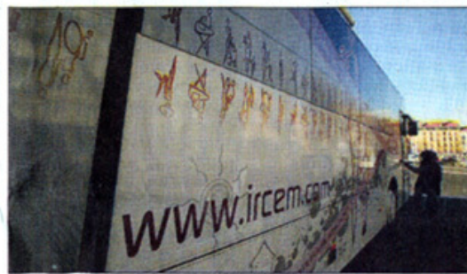
Le bus de l'IRCEM est au Puy jusqu'à mercredi